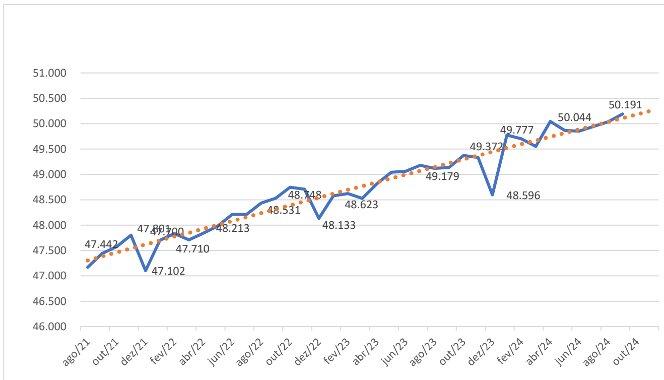
Figura 3 – Tendência de Empregos Formais em Bento Gonçalves

Obs: Projeção de 50,2 mil empregos em outubro/24 - Aderência aos dados de 93,3% ( R^2 - regressão linear)